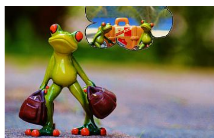
(snít o) dovolené