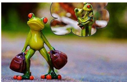
(snít o) žábě